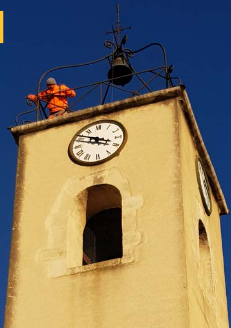
Patrimoine : Travaux d'entretien et de rénovation de l'église par les services techniques de la Ville.