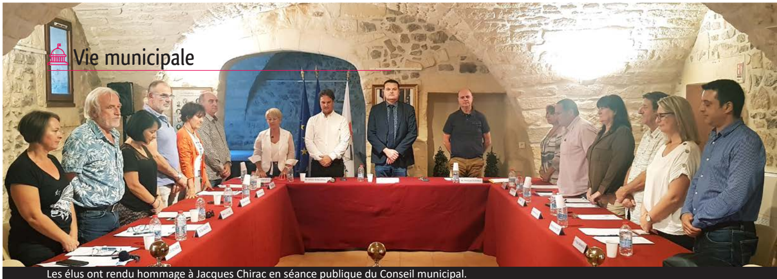
Les élus ont rendu hommage à Jacques Chirac en séance publique du Conseil municipal.