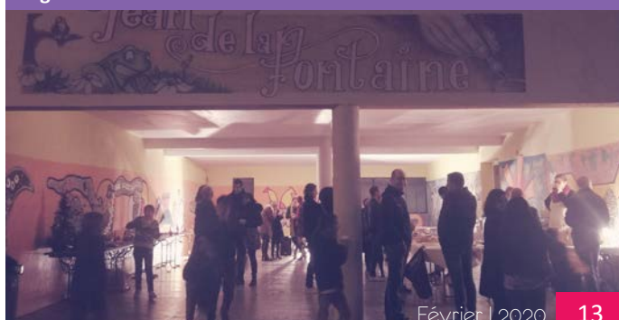
Le goûter de Noël de l'école élémentaire.

Contact : 04 67 70 38 14 ce.0341403r@ac-montpellier.fr.