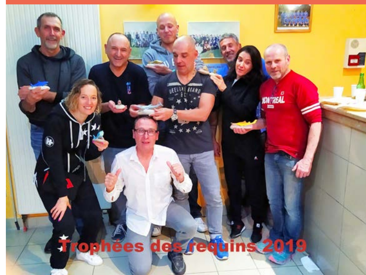
Trophées des requins 2019

Découvrez ce club et ses activités à travers leur page Facebook.