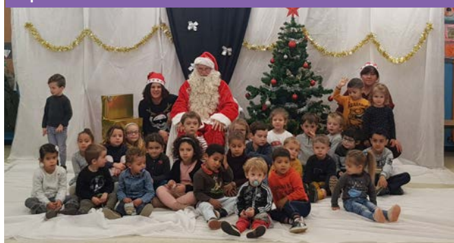
La photo avec le Père Noël à l'école maternelle.

La coutume perdue à l'école élémentaire ! Les enseignants et les enfants ont donné rendez-vous aux parents pour fêter la fin de l'année autour d'un goûter préparé par les parents d'élèves. L'occasion pour les parents de découvrir le travail créatif et artistique de leurs enfants.