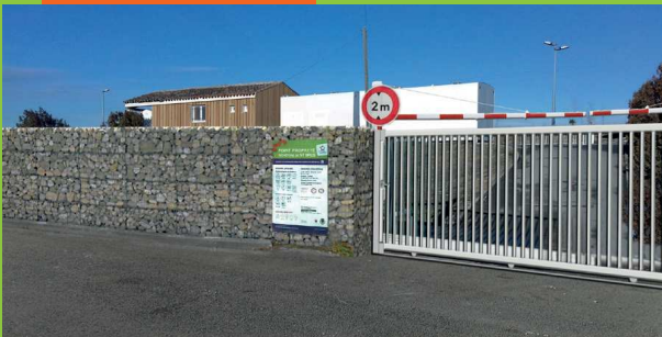
Déchèterie de Saint-Brès

VOTRE DÉCHÈTERIE ROUVRIRA EN FÉVRIER 2020