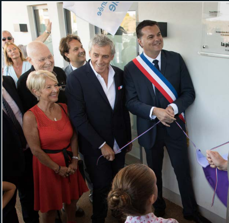
22 septembre 2018, Joseph Rodriguez lors de l'inauguration de la piscine Héraclès, aux côtés du Préfet de l'Hérault, de Philippe Saurel, Président de la Métropole et des membres du Conseil municipal de Saint-Brès.