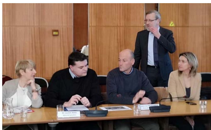
En début d'année, les élus ont été reçus par le Préfet, pour une réunion de concertation.

L.J. : "J'ai le sentiment depuis le début que l'on nous promène. Dans cette affaire, l'État veut nous rouler dans la farine. En 2015, le projet de déviation de la RN 113 était inscrit dans le Contrat de Plan État Région. L'année suivante, des études étaient menées par la Direction Régionale de l'Environnement, de l'Aménagement et du Logement (DREAL) afin de définir un tracé pour cette déviation. Au printemps 2017, lors d'une réunion en Préfecture avec les Maires et les collectivités concernées (Région, Département, Métropole de Montpellier, Agglomération du Pays de l'Or), les services de l'État nous ont présenté quatre variantes. Un consensus s'est dégagé sur l'une d'elles. Avec mes collègues Maires, nous souhaitons, et nous le souhaitons toujours, que cette déviation ne coûte pas un seul euro aux usagers qui l'emprunteront. Malgré quelques ajustements sur lesquels