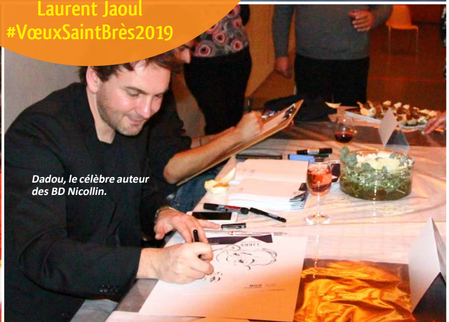
Dadou, le célèbre auteur des BD Nicollin.