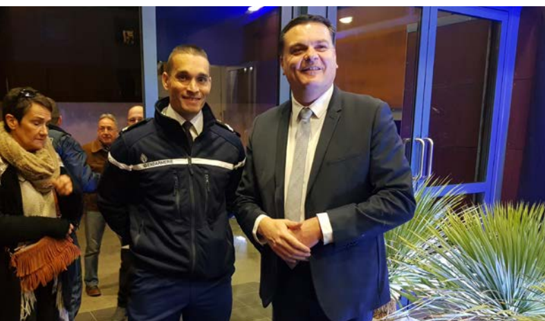
Présence de la gendarmerie de Castries.