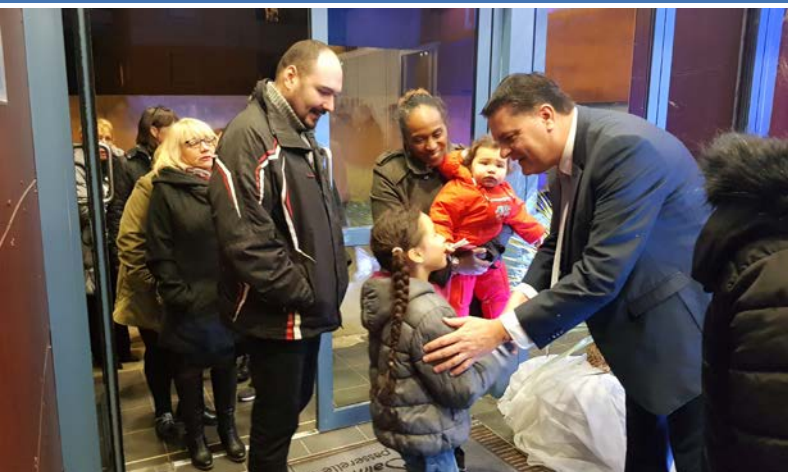
Le Maire accueille les Saint-Brésois.

Le Maire et son épouse ont accueilli personnellement et chaleureusement chacun des invités à l'entrée de la salle. Les bises et poignées de mains échangées entre l'édile et ses administrés ont démarré en douceur cette cérémonie avant la prise de parole officielle.