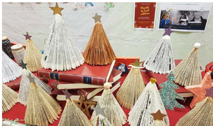
Un grand projet d'action de solidarité auquel les enfants du centre de loisirs de St-Brès vont participer pour l'association « SOURIRE A LA VIE » !!

Touchée par la cause et par les missions menées par l'association Sourire à la vie, l'équipe du Centre de loisirs a proposé de réaliser des actions tout au long de l'année pour apporter un soutien financier.