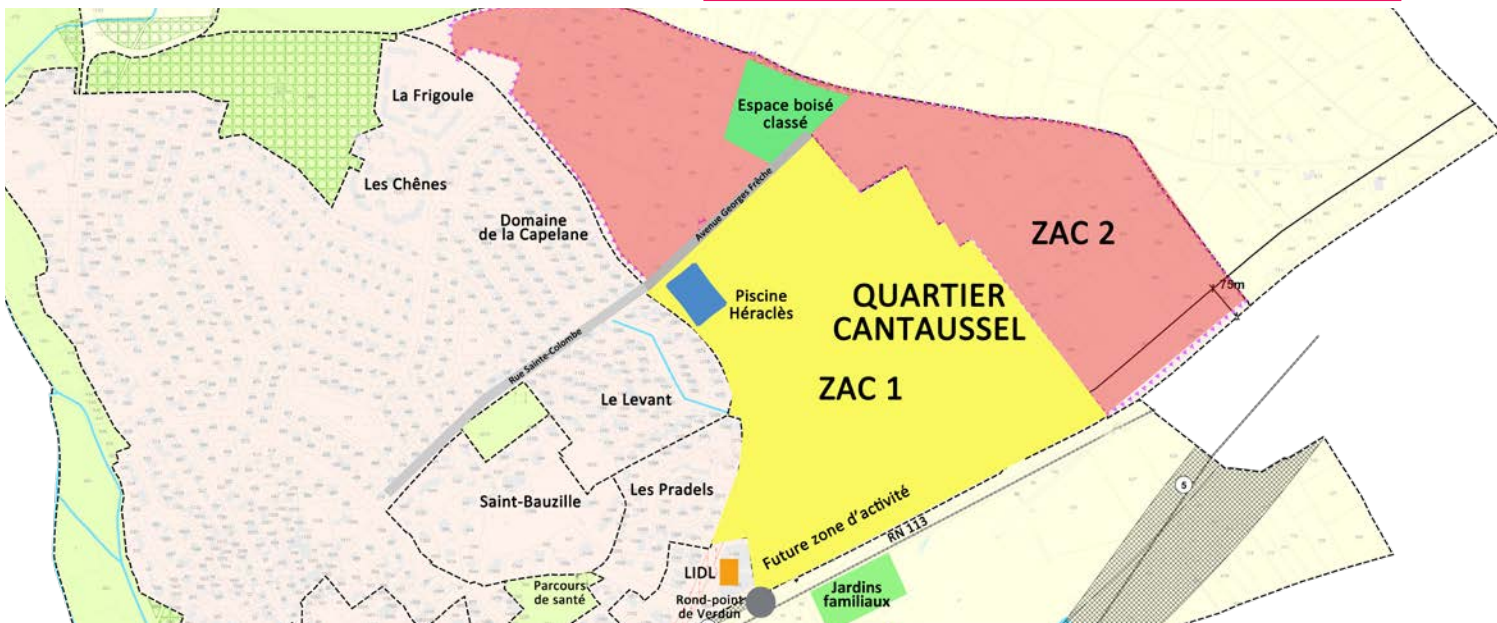
Prévue dans un premier temps pour accueillir 600 logements, la ZAC 2 a été bloquée par le Maire. Elle pourrait ne jamais voir le jour...

résultat des études confiées par l'État à Vinci Autoroutes. Hélas, nous allons entrer dans une période de réserve électorale, due aux élections européennes. Au cours de cette période, les préfets et les fonctionnaires de l'administration préfectorale et des autres services de l'État, ne doivent pas participer à des réunions avec les élus. Le dossier de concertation publique doit, en principe, être présenté aux maires des communes concernées au mois de juin, après l'élection des députés au parlement européen. Viendra ensuite le temps des procédures administratives qui prendra au minimum 24 mois (Procédure de Déclaration d'Utilité Publique ; arrêté de cessibilité et des acquisitions foncières ; déclaration de projet ; mise en compatibilité des plans locaux d'urbanisme des communes concernées ; procédure d'autorisations environnementales ; volets Loi sur l'Eau ; volets habitats / faune / flore ; archéologie préventive), puis trois à quatre années supplémentaires pour les travaux de la déviation.