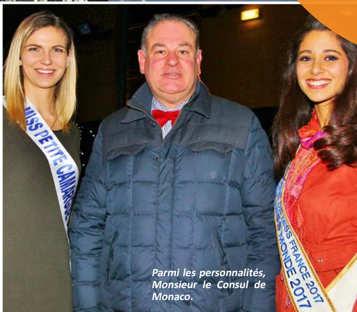
Parmi les personnalités, Monsieur le Consul de Monaco.